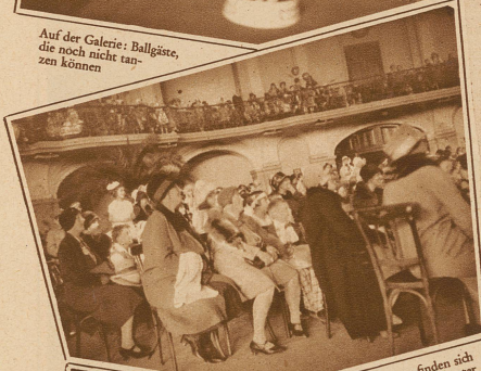
Selbst Mütter finden sich beim Kasperltheater in die Kinderzeit zurückversetzt