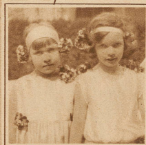
Kinder des Frühlings