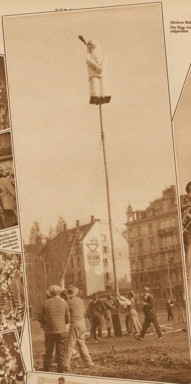
Mittleres Bild: Der Bögg wird aufgerichtet