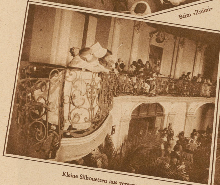
Kleine Silhouetten aus vergangener Zeit