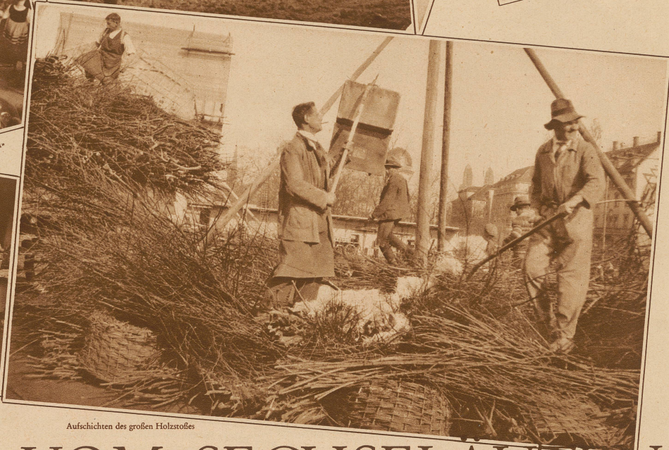
Aufsichten des großen Holzstoßes