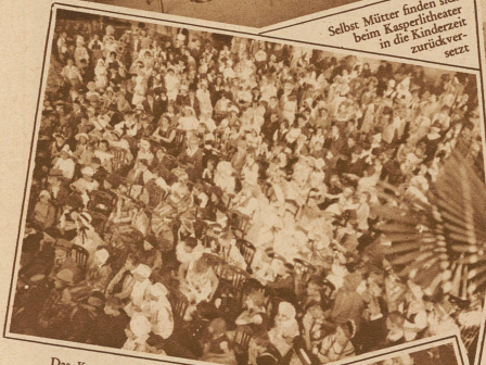
Das Kasperltheater hat großen Zuspruch