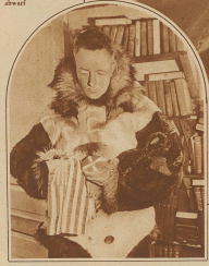
Die Zürcher Illustrierte hat das gesamte Bildmaterial von Byrds Expedition zum Südpol erworben und ist als alleinige Zeitung der Schweiz in der Lage, ihren Lesern diese einzigartigen Aufnahmen zu zeigen. Weitere Bilder erscheinen in den folgenden Nummern.