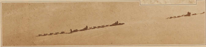
Flugaufnahmen einer Handvoll Meereskarren. Sie ist unterwegs ins Innere der Polarkontinente, wo zur Sicherung der Polflüge ca. alle 100 km Depots angelegt wurden.