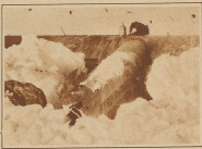
Einem Geographen, der vor Byrd noch kein menschliches Auge gesehen hat, wird zunächst das gepackte in diesem Bild auf dem Flug zum Südpol zwischen dem 86. und 87. Breitengrad.