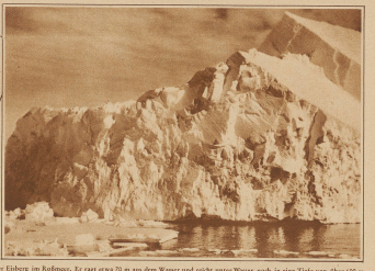
Ein riesiger schwebender Eisberg im Radium. Er ragt etwa 70 m aus dem Wasser und reicht unter Wasser noch in eine Tiefe von über 600 m.