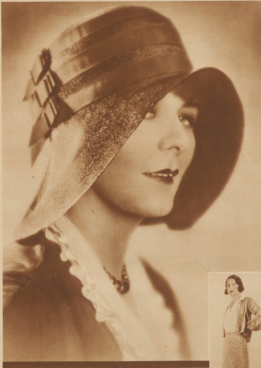
Strohhat mit schwungvoller Nackenlinie