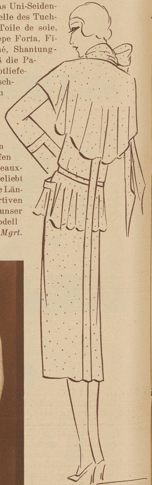
Aparter Mantel aus leichtem, marineblauem Wollstoff, weiß und rot-punktiert; die reichen Volants in der Hüftpartie sind typisch für die Sommer-Kollektion Jenny, Paris