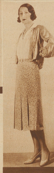
Bolero-Kostüm aus bedrucktem Crêpe de Chine; die geschlitzten Vorderärmel sind eine originelle Idee vom Hause Redfern, Paris

stellpalette Hauptlieferant der Waschseide-Farben ist, und daß neben glatten und in sich gemusterten Seiden auch Streifen und feine Careaux-Effekte so beliebt sind. Über die Länge des sportiven Kleides gibt unser Lenglen-Modell Aufschluß. Mgrt.