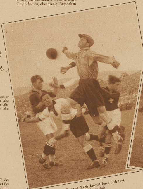
Der deutsche Torwart Krell faustet hart bedrängt eine Flanke ins Feld zurück

Und wenn mer jezt de vorder Teil vom Ascht billig übercho hetti, de hinder hetti de Heiri nüd fürs Zahlchi verchauft. — Begriffli!