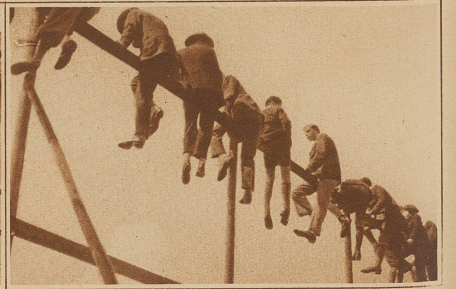
Zaungäste verschiedensten Alters. Nur für Leute ohne Schwindel und mit guten Augen