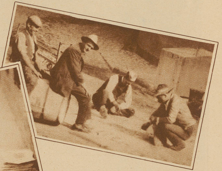
Sogar während der kleinsten Arbeitspause wird gespielt