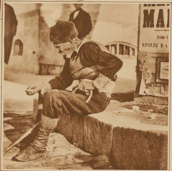
Alles, alles verspielt!