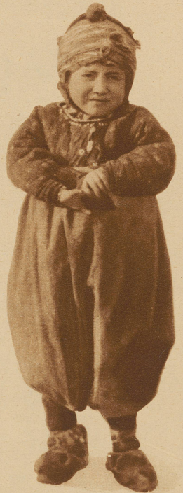
«Vatti, Mutti hat gesagt, du sollst heimkommen bevor du alles Geld verspielt hast!»