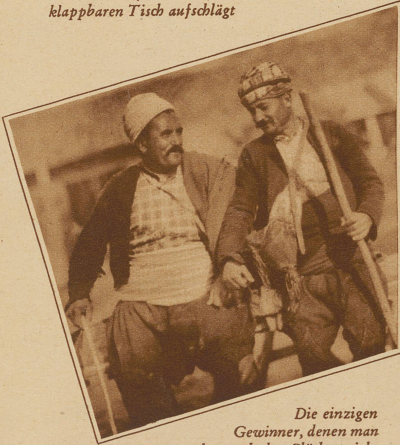
Die einzigen Gewinner, denen man aber auch das Glück ansieht