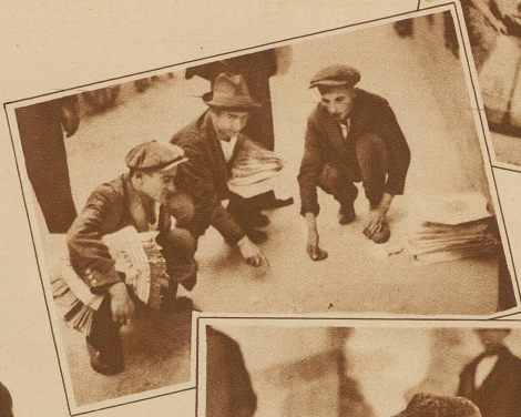
Zeitungsverkäufer verspielen ihre ganze Tageseinnahme

Diese Spieler sind echte Kämpfer, achten den Gewinn nicht, sie sind In-das-Spiel-Verliebte, für sie ist das Leben ein Rendezvous mit sich selbst und dem Glück: sie warten noch. Sie nehmen jeden Einsatz an, da sie sich des Gewinnes des Nichtstuns gewiß sind.