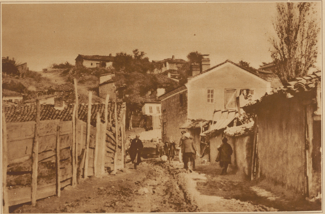
Und so sehen die Straßen aus, in denen gespielt wird