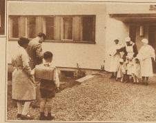
Die Chetraz fotografieren die Oberkammer beim Einzug zum neuen Heim