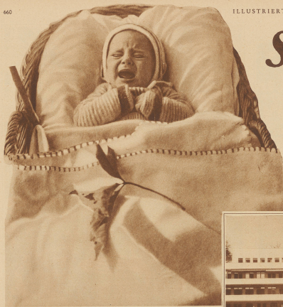
Ein unzufriedener Gast des Säuglingsheims. Die Verhältnisse scheinen nach Abbildung

In Bern ist an Stelle der Säuglingsanstalt im Rappental, die längst zu klein und dem hygienischen Forderungen der Neuzeit in keiner Weise mehr gewachsen war, ein moderner Eisenbetonbau erstellt worden. Bei der öffentlichen Beachtung konnte man die hellen, in Licht getauchten Räume, die vielen Apparate und Hilfsmittel zur Säuglingspflege bewundern. Hier glänzten kleine lustige Badewannen auf, dort warf ein regelrechter Park von Stuhlwagen, die zweifellos ihrer Bestimmung