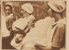
Die Säuglinge werden verabschiedet. Das Auto fährt gleich vor