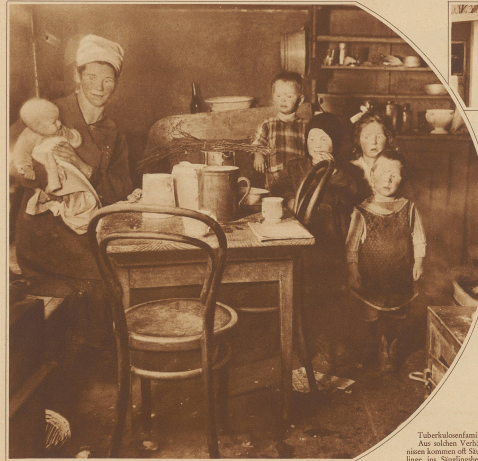
Tuberkulosefamilie. Aus solchen Verhältnissen kommen oft Säuglinge ins Säuglingsheim