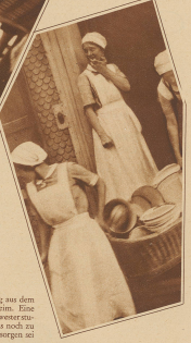
Auszug aus dem alten Heim. Eine Oberkammer gerodert, was noch zu bewegen ist