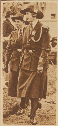
Prinzessin Mary, die englische Königstochter, in ihrer Uniform als Pfadfinder-Führerin