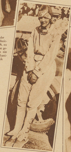
Baronin d'Eterné, die bekannteste Automobil-Rennfahrerin Frankreichs, fuhr beim Rennen um den großen Preis von Algerien gegen einen Kilometerstein und blieb tot am Platze