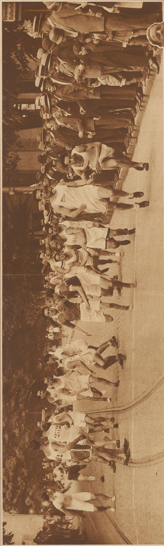
Die erste Stabübergabe der B-Klasse. Rechts außen der Turnverein Olten, der schon hier einen kleinen Vorsprung hat und bis ins Ziel einen klaren Sieg erkämpfte