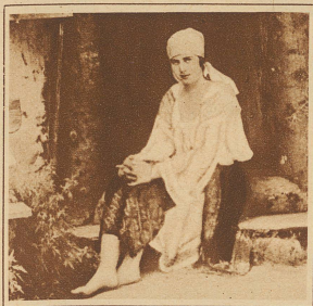
Prinzessin Ileana von Rumänien, berühmt wegen ihrer Schönheit, ist vorübergehend des modernen Komforts müde und zeigt sich hier barfuß als Bewohnerin einer ärmlichen Hütte