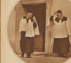
Chorherren kommen von der Veiper