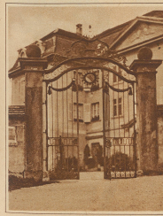
Die Residenz des Papstes, Barockhaus aus dem 17. Jahrhundert