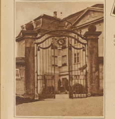
Die Residenz des Papstes, Bero-Münster aus dem 17. Jahrhundert