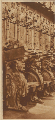
Chorgerichte aus dem 16. Jahrhundert, gezeichnet durch die Gebr. Huber in Luzernberg

Bislang lebte nämlich unser Flecken zu Füßen des stillen alpenwäldigen Chorherrenstiftes still sein gerahmtes Leben, wie schon viele Jahrhunderte lang, seit um 980 Graf Bero von Leuzburg nach der Sage dieses Gotteshaus stiftete. Die Kirche soll an der Stelle stehen, worauf des reichen Grafen einziger Sohn nämlich der Särenspeer den Tod fand. Die mannigfachen Geschehnisse hat das Stift