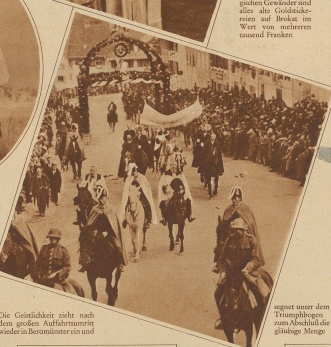
Die Gefährlichen reiten nach dem großen Aufbühnenfesten wieder in Beromünster ein