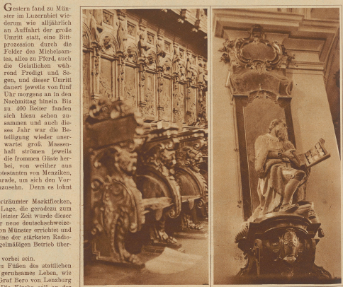
Chorgericht aus dem 16. Jahrhundert, gezeichnet durch die Gebr. Huber in Luzernburg

Bislang lebte nämlich unser Flecken zu Füßen des stützlichen alchirurgischen Chorherrenstiftes still seit gerühmtem Leben, wie schon viele Jahrhunderte lang, seit um 180 Graf Bero von Leuzburg nach der Sage dieses Gotteshaus stiftete. Die Kirche soll an der Stelle stehen, worauf des reichen Grafen einziger Sohn nämlich der Särensapfel dem Tod fand. Die mannigfachen Geschehnisse hat das Stift