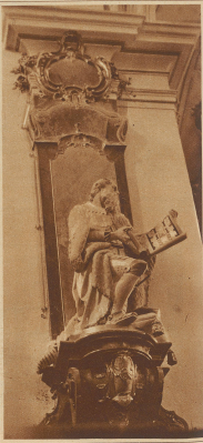
Statue Graf Beros von Leuzburg, des Stifters von Beromünster