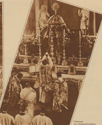
Feierliche Anrichtungsarbeiten des Hochaltars der Stiftskirche. Die Altarverkleidungen und liturgischen Gewänder sind alle aus Goldstickereien auf Beize im Wert von mehreren tausend Franken