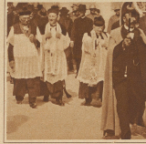
Bild links: Der gegenwärtige Propst von Beromünster (links außen), sowie der Pfarrer des Fleckens, der Dekan von Hitzkirch und der Gemeindevorstand (rechts vorne) verlesen öffentlich die letzten Worte des Propstes zur Kirche zu St. Stephan