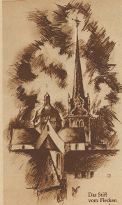
Das Stüb von Flecken aus gesehen

Gestern fand zu Münster im Luzerner wieder, wie alljährlich an Auffahrt der große Umritt statt, eine Prozession durch die Felder des Michelsamtes, alles zu Pferd, auch die Geistlichen während Predigt und Segen, und dieser Umritt dauert jeweils von fünf Uhr morgens an in den Nachmittag hinein. Bis zu 400 Reiter fanden sich hier schon zusammen und auch dieses Jahr war die Beteiligung wieder unerwartet groß. Massenhaft strömen jeweils die frommen Gläubigen herbei, von weither aus