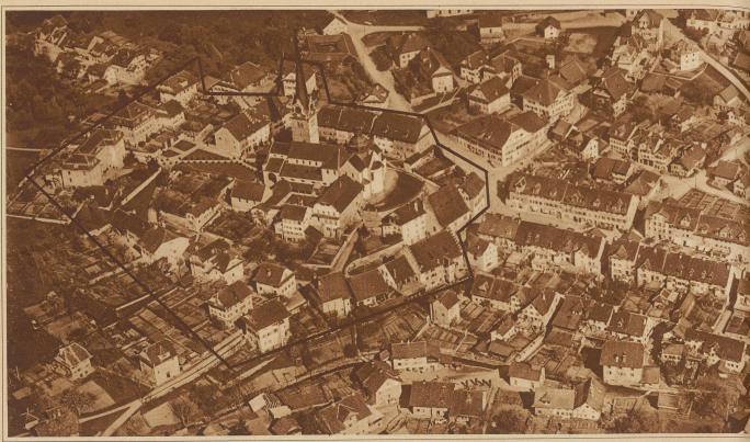
Hieraufnahme des Flecken-Bero-Münster aus 192 in Höhe. Die schwarze Linie umgibt die zum Stift gehörenden Gebäulichkeiten