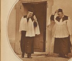
Chorherren kommen von der Veiper