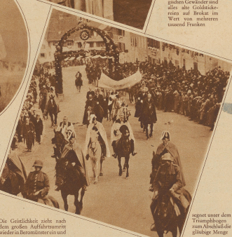
Die Gefährlichen sind nach dem großen Aufbühnenfest wieder im Bero-Münster einwand