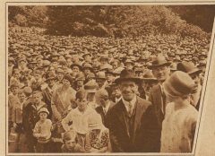
Kopf im Kopf drängt sich die Zuschauermenge beim Alpenbläsern auf dem Platz...