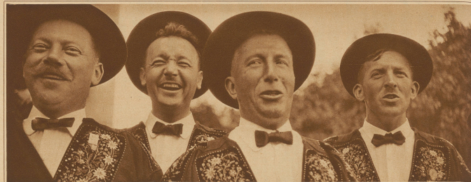
Lurgi, vo Bl-ig und Tal...