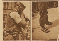
Die obere und die untere Hälfte eines Alpenbläfers