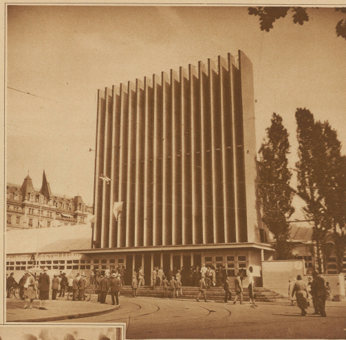
Der Hauptingang der «Zika»