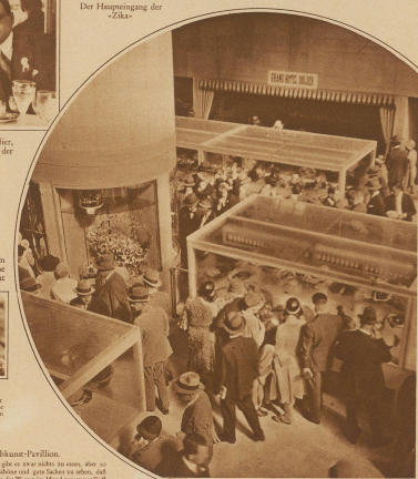
Im Kochkunst-Pavillon. Man gibt es wie man will, es muss aber gut sein und gut zu sehen, das wenn es Wert im Markt ist