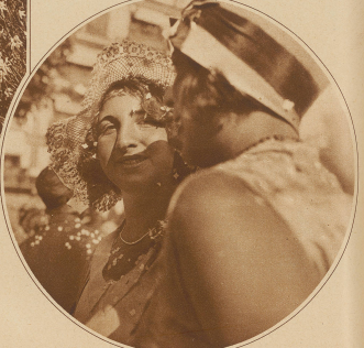
Ein herrlicher Arm, ein schöner Hut und einige offizielle Konfetti im Haar, die ist eine kleine Probe von den zahllosen hübschen Dingen, die es zu sehen gibt

Detail vom Blumenkranz: Kleine Frauen die tragen die Blumen und Konditionen von Montreux die eine Torte darstellen.