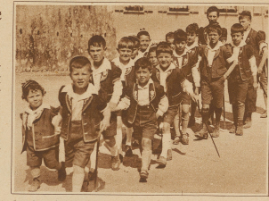
Junge Sennen im Umzug