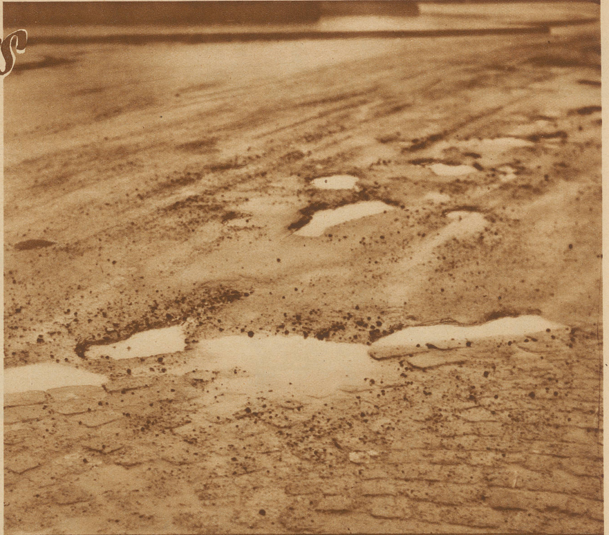
Eine Dorfstraße? Nein, einer der belebtesten Plätze der Bundesstadt. «Es lächelt der See...»