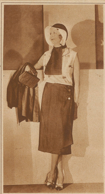
Ein entzückendes Rohseide-Kostüm mit passendem Hut