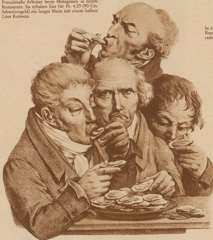
L. BOILLY: Kostprobe der Austern

Wohin also soll die Sehnsucht nach guter, herrlicher, echter französischer Küche geführt werden? Eine festgelegte Antwort gibt es auf diese Frage nicht. Es können nur Regeln aufgestellt werden, die aber sehr elastisch sind. Vor allem glaube man ja nicht, daß man in Paris gut und billig essen könne.