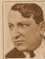
FRANCIS CARCO ist am letzten Bankett der «Gogognes» zum «König der Schlafaffen» ernannt worden