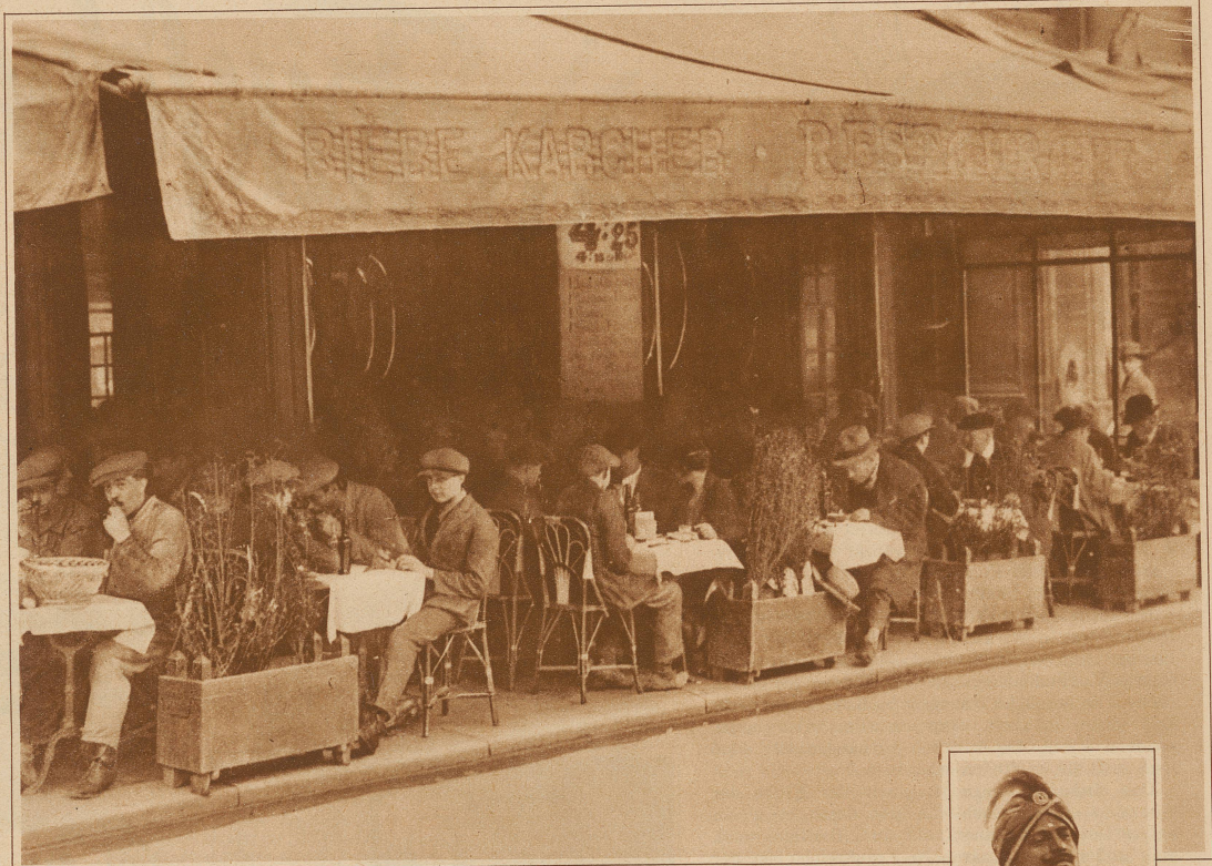
Französische Arbeiter beim Mittagessen in einem Restaurant. Sie erhalten hier für Fr. 4.25 (90 Cts. Schweizergeld) ein langes Menu mit einem halben Liter Rotwein