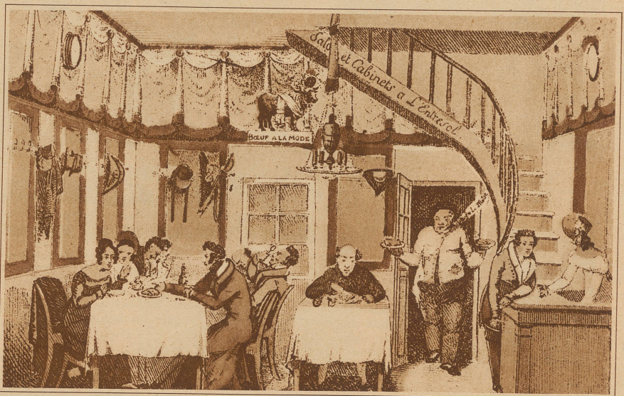
«Le Boeuf à la Mode» (1792)