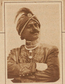
In einem Montparnasse-Restaurant soll dieser Paradehindu den Gästen Appetit machen