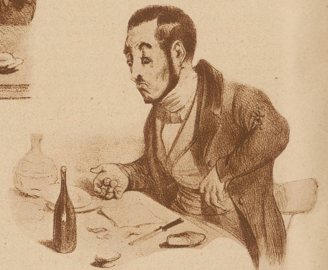
Ein Daumierschüler zeigt hier die Verzweiflung eines Gourmets, der seine Zeche nicht bezahlen kann

Der Weg zum guten Essen in Paris führt über zahllose Enttäuschungen, über mißglückte Experimente, die nichts als einen verdorbenen Magen ergeben.