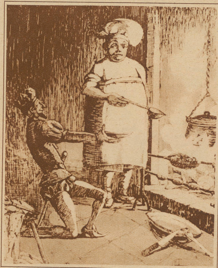
Bild links: Der einzige Mann, vor dem sich der Tyrann auf die Knie warf, war sein Koch

Dem Ausländer wird aber die Lösung seiner Feinschmeckerprobleme durch Eintritt in einen Klub nicht leicht sein. Die 100, die 25 und die 13 des «Club des Treize» sowie die zwei Dutzend des weiblichen Feinschmeckerklubs «La Belle Perdrix» sind immer komplett, und auf den Pariser Korsos trotten Hunderte von Kandidaten herum, die auf den Augenblick harren, da eine gütige Leberkrankheit irgendein Mitglied eines Klubs dahinrafft.