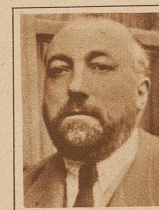
Der Modekünstler PAUL POIRET ist aus dem «Club des Cent» ausgeschlossen worden. Poiret ist auch Verfasser eines Kochbuches