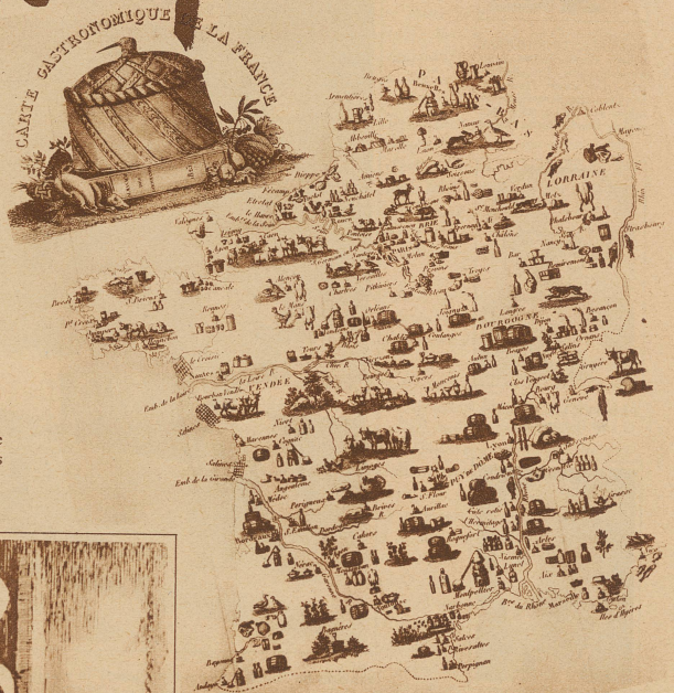
Gastronomische Landkarte Frankreichs

Jeder Ausländer, der das erstmal nach Paris kommt, erlebt zwei kleine Enttäuschungen: die lustige französische Frivolität und die herrliche französische Kost wird er vergeblich suchen; er wird sie nicht finden.