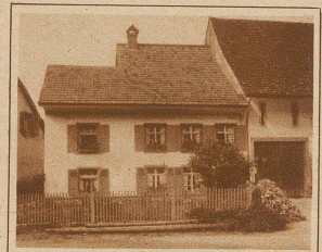
Jakob Schaffners Heim in Ormalingen