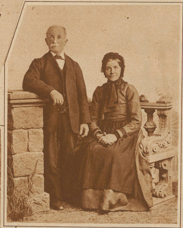
Jakob Schaffner als 70jähriger mit seiner Frau