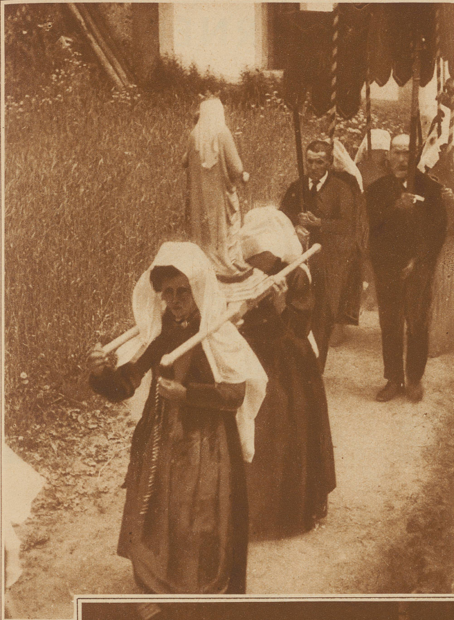
Frauen tragen eine Marienstatue in der Prozession in Blatten