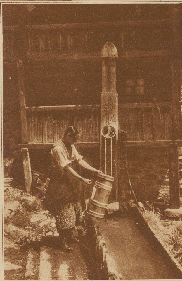
Stimmungsbild an einem Brunnen in Kippel