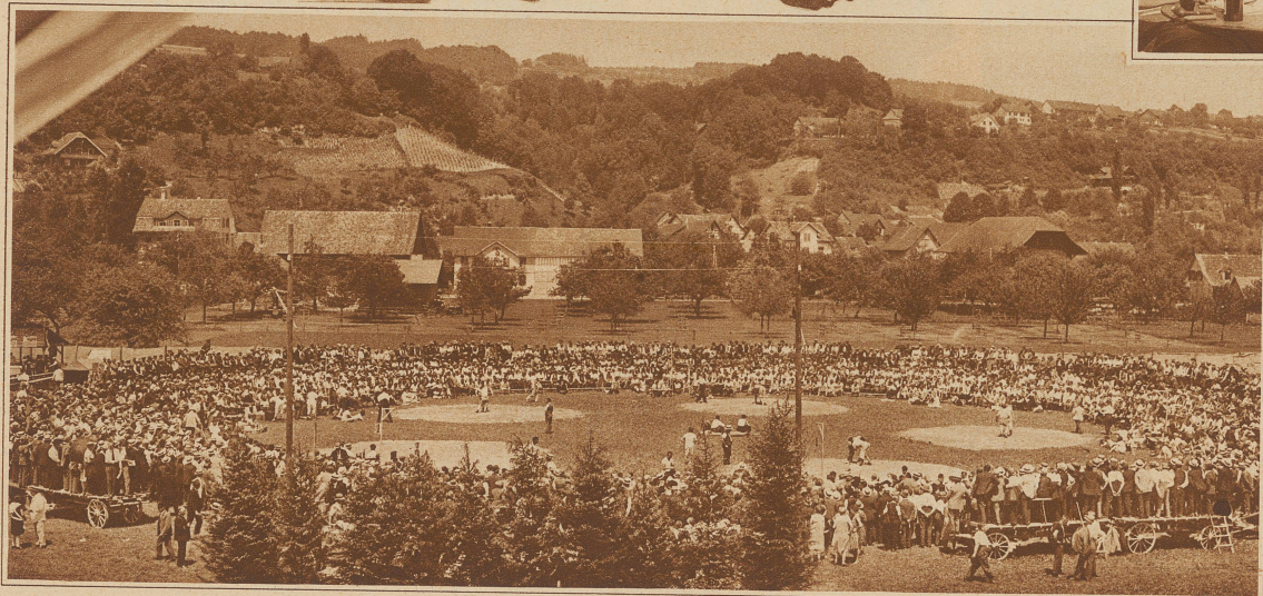
Blick auf den mit Zuschauern dicht umsäumten Festplatz