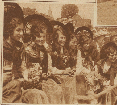
Die schmücken Thurgauerinnen scheinen an den stämmigen Schwingern Gefallen zu finden