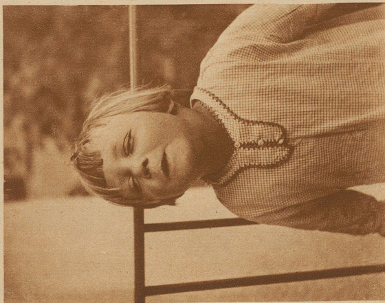
Erst muß ich riechen, was es Gutes gibt. — —

Eine Erzählung in Bildern von dem Erlebnis, das Trudi neulich vor dem Mittagessen hatte.