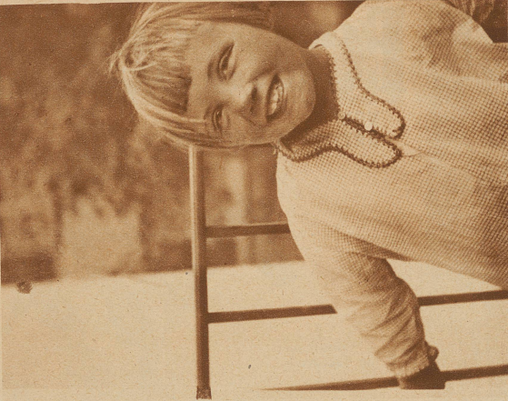
Nun hat er mich doch gesehen. —