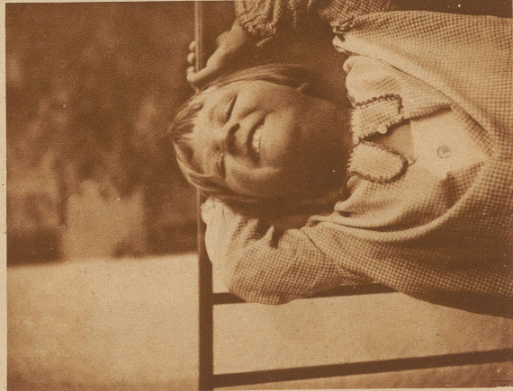
Es ist zu peinlich. — Wie sag' ich's nur meinem Papa?? — —