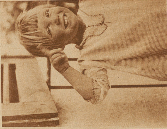
Ja! Aber Mama... soll auch nicht immer Käseschnitten backen! ...