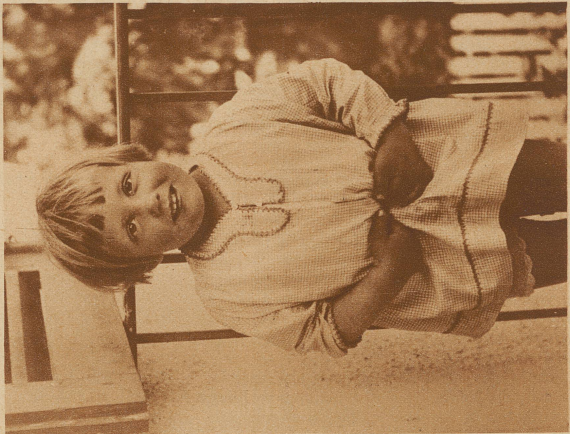
Ich kann nicht essen, — ich habe schrecklich Bauchweh. — —