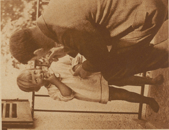
Papa redet mir ernstlich zu, ich müsse immer die genaue Wahrheit reden. Ich hätte gar kein Bauchweh, sagt er. Ob er wohl recht hat?