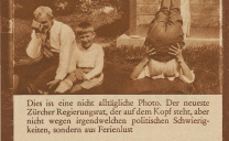
Dies ist eine nicht alltägliche Photo. Der neuzuer Zürcher Regierung, die auf dem Kopf stieg, aber nicht wegen irgendwelchen politischen Schwärzungen, sondern aus Verzweiflung