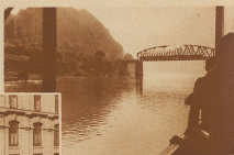
Nicht sehen So stellt sich die Welt dem dar, der in die Ferien reisen darf!

Die Schweiz, ein glückliches Land! Vierlinge aus dem Kanton Thurgau, heute im ersten Jahre ihrer Kindheit von 9 Jahren. Jedes Kind hat viermal geblutet und alle haben ohne Schaden die Seuche überstanden und ihr Konvaleszenz gemessen, in der Zürcher Illustrierten veröffentlicht zu werden. Ein Weibchen ist, schreibt uns der Einsender, nun, da mühen wir natürlich publizieren