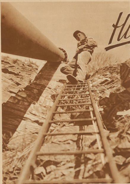
Ein junger Berner Monsieur, der hoch hinaus will. Der Vorfall ist ernsthaft, aber die Aufnahme humorvoll.