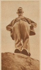
Dieser St. Galler, Job in Amerika auf großen Fuß!