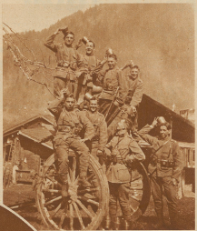
Met.-An.-Rekrutenschule in Thun, aufgenommen während dem Schuljahr mit den 12 cm Hauptknoten. Die Redaktion freut sich, daß die Rekruten so munter sind