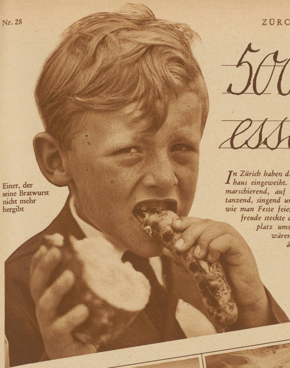
Einer, der seine Bratwurst nicht mehr hergibt

In Zürich haben die Schulkinder kürzlich das Milchbuck-Schulhaus eingeweiht. In einem bunten Festzug durch die Stadt marschierend, auf einer grünen Festwiese musizierend und tanzend, singend und springend, haben sie den Alten gezeigt, wie man Feste feiern soll. So viel echte Lebenslust und Festfreude steckte die Kinderfreunde an, die begierig den Festplatz umsäumten und gern wieder jung geworden wären. Aber wie die ältern Jahrgänge auch im ärgsten Festtrubel nicht ohne festwirtschaftliche Genüsse auskommen, so wäre ein Jugendfest ohne Bratwurstbankett für die Jugend so undenkbar, wie für die Knaben ein Knabenschießen ohne Bratwürste. Deshalb mußten über 5000