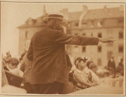
Das Bankett ist vorüber. Der Herr Lehrer wünscht, daß überall die Papierfetzen zusammengelesen werden

Bratwürste, ebensoviele Wegen und eine schöne Anzahl Milchkanen voll Tee daran glauben. Wenn die Schulkinder sich nach dem Fest in müßigen Hoffnungen ergeht, weil sie jedes Jahr zu einer Schulhauseinweihung eingeladen werden möchte, so sind nicht nur der bunte Festzug und die vielen Produktionen auf der Festwiese daran schuld, sondern nicht zuletzt auch die lange Bratwurst. Als wenn es daheim nie so etwas Köstliches gäbe!