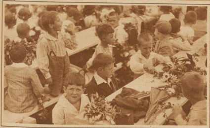
Die Festzugsteilnehmer harren der guten Dinge, die aufgetischt werden sollen