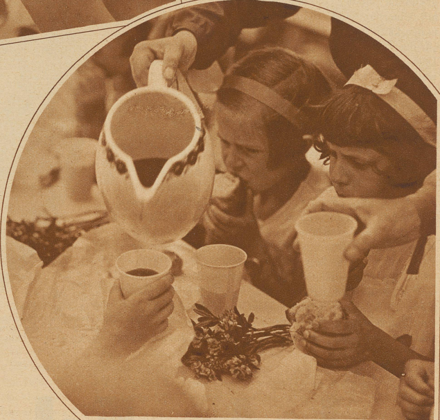
Ohne Tranksame käme auch die vollendetste Bratwurst nicht zu voller Wirkung