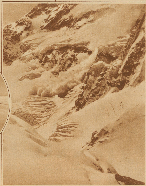
Untenstehendes Bild: Eine unvergleichliche Aufnahme vom Absturz einer gewaltigen Staublawine am Kangchenjunga. Die Lawine stürzte etwa 2000 m tief hinunter und hatte eine solche Wucht, daß sie unten auf dem flachen Gletscher noch fast einen Kilometer weiterlief