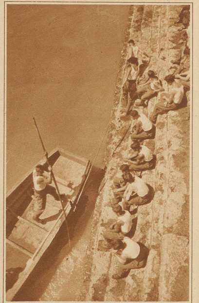
«Wolgschleppern» gleich ziehen Pontoniere der Sektion Sisseln ein Boot flussaufwärts