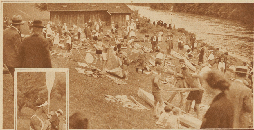
Lagerleben am Ziel in Wettingen