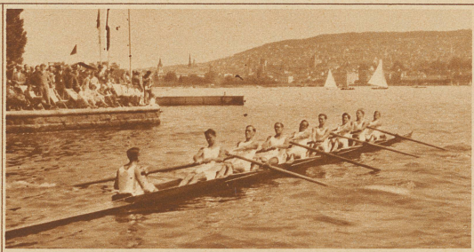
Der siegreiche Junioren Achter des Deutschen Rudervereins Zürich