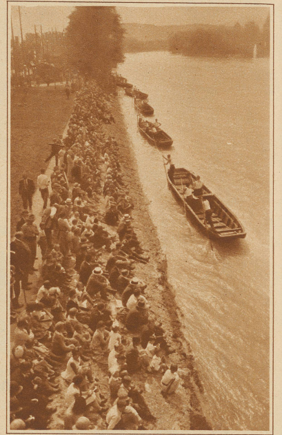
6 Pontons der Sektion Wangen a. Aare haben den Fluß gemeinsam überfahren und stacheln eilig dem Ufer entlang stromaufwärts