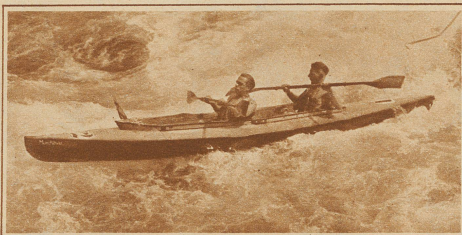
Im Zweisitzer durch die Wirbel der Limmat