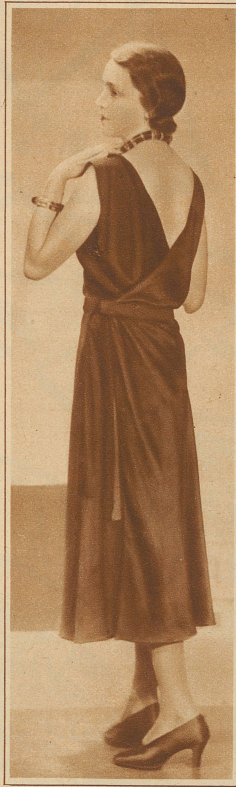
Nachmittags- oder Abendkleid, dessen Einfachheit inmitten phantasierender Modeschöpfungen auch schon fast wie «Reform» oder Protest wirkt

Eine der ersten Taten der Nationalversammlung nach der französischen Revolution war die feierliche Abschaffung aller Standesunterschiede in der männlichen Kleidung. Aber an den Folgen des geistreichen Einfalls des damaligen Oberzeremonienmeisters Drex de Brézé trägt die Welt heute noch! Gegen den aus dieser Vorschrift resultierenden Einbruch von Nüchternheit und Düsternis in der Männerkleidung kämpfte bereits Napoleon vergeblich. Während 140 Jahren hat nun die Masse Mann weder Zeit gefunden, noch es für der Mühe wert gehalten, sich ihre Kleidung einmal kritisch zu betrachten. Selbst der moderne Mann trägt noch immer Scheuklappen in Bezug auf seinen Anzug. Er rast durch Erdteile, umfliegt die Welt, aber zur Dreieinigkeit von Rock, Hose, Weste findet er nicht Distanz genug, um sie mit ihren dem 18. Jahrhundert entnommenen Prinzipien als überlebt zu erkennen.