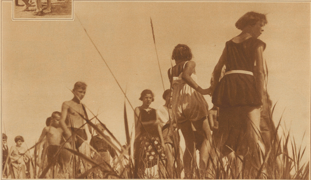
Mit Faulenzen und Spiel darf die Freizeit verbracht werden

«Freundschaft» rufen sich die Kinder zu, wenn sie einander grüßen. Wenn jedes Kind das Erlebnis einer wahren Freundschaft aus der bekömmlichen Schweizerluft mit nach Hause trägt, dann kann die Konstitution der Kinderrepublik, als von Erfolg gekrönt, wieder aufgehoben werden.