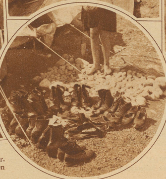
Im Kreis: Die Schuhe würden in den Zelten, in denen je ein Dutzend Kinder schlafen, nur unnötig Platz versperren