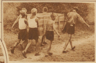
Das Röhrenlegen zur Beseitigung des Abwaschwassers will gelernt sein und braucht kräftige Arme