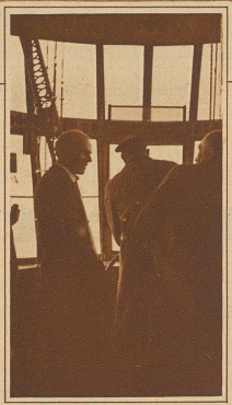
General Nobile als Fahrtteilnehmer im Navigationsraum. Mit welchen Gefühlen mag dieser Mann, der mit einem selbstgebauten kleinen Luftschiff zweimal über den Nordpol flog, heimgekehrt sein?