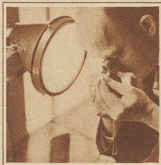
Juwelen werden durch besondere Fachleute untersucht

technischen Vorbereitung gelang es der unermüdlischen Arbeitsgruppe, alle wichtigen Begebenheiten des Mövenlebens in ausgezeichneter Weise auf das Filmband zu bannen und überdies eine Reihe prächtiger photographischer Aufnahmen zu machen, von denen die Bilder eine kleine Probe geben.