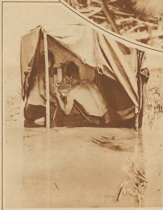
Bild links: An der Arbeit im Kinozelt. (Das Zelt ist hier geöffnet, um das Innere zu zeigen.)

tes ein. Morgens in aller Frühe ging's durch die taufrischen Wiesen zum kalten Bad (8° C) in der Linth. Das schützte gegen Erkältungen, denn die Aufnehmenden standen bis zu 10 Stunden täglich im Wasser. Daß sie dabei