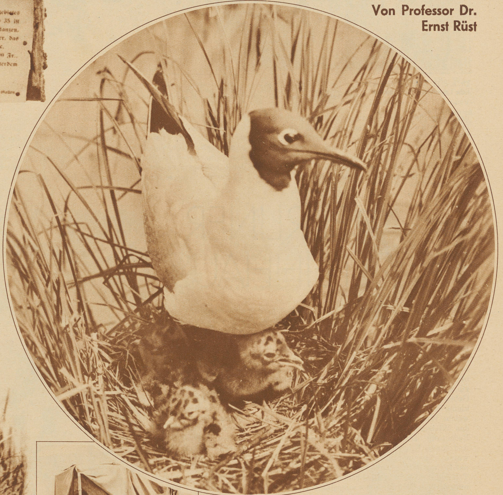
Lachmöve mit Jungen