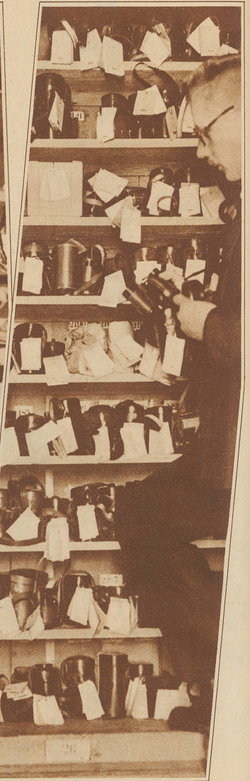
Feldstecher und Operngläser en gros — alles im Leihhaus Phot. P. & A.