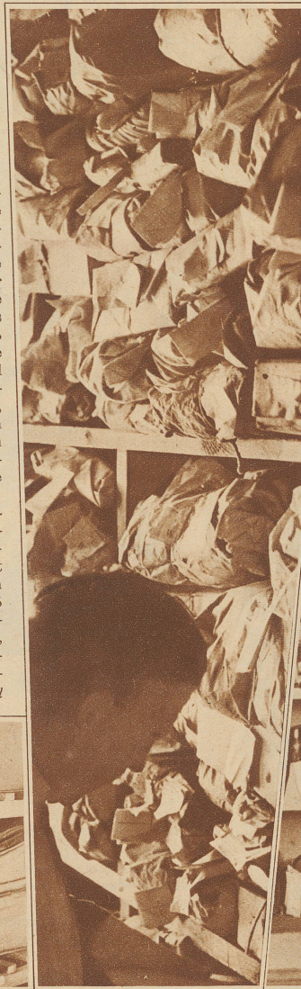
Wäsche wird in Bündel verpackt und auf großen Gestellen aufgestapelt