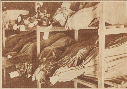
Im Lager der Musikinstrumente