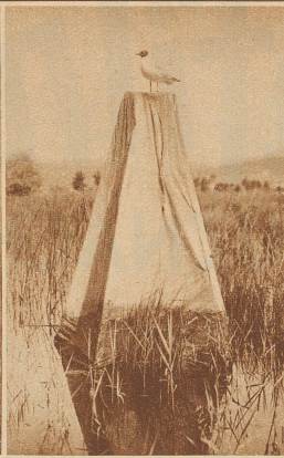
Das Photozelt. Die Möven sind sonst sehr mißtrauisch und stürzen sich gut, wenn ein Mensch das Zelt betreten hat. Da sie offenbar nicht auf zwei zählen können, so sind sie befriedigt, wenn eine Person das Zelt wieder verläßt, selbst wenn vorher mehrere Personen gleichzeitig darin verschwunden sind