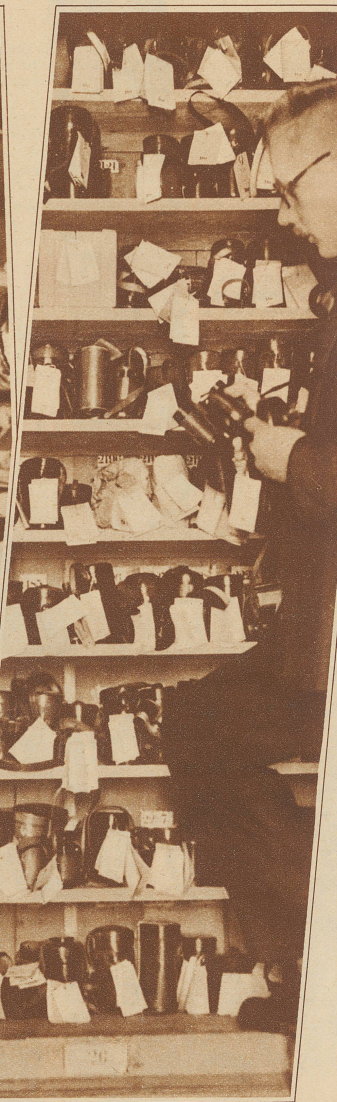
Feldstecher und Operngläser en gros — alles im Leihhaus Phot. P. & A.