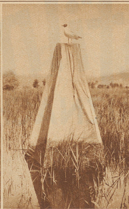
Das Photozelt. Die Möven sind sonst sehr mißtrauisch und stürzen sich gut, wenn ein Mensch das Zelt betreten hat. Da sie offenbar nicht auf zwei zählen können, so sind sie befriedigt, wenn eine Person das Zelt wieder verläßt, selbst wenn vorher mehrere Personen gleichzeitig darin verschwunden sind