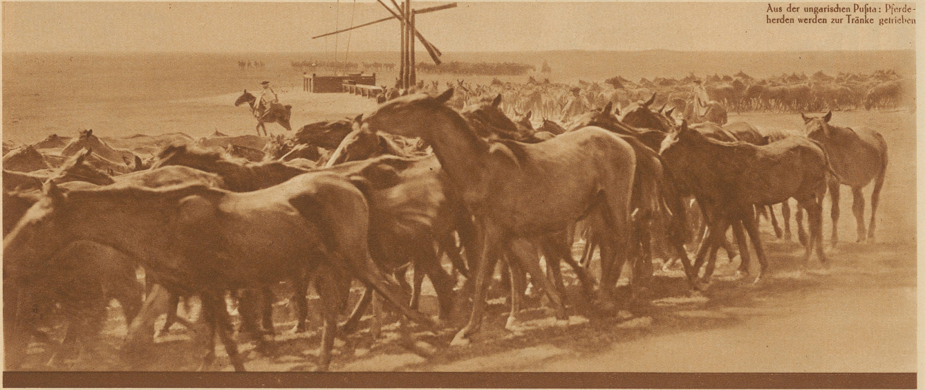
Aus der ungarischen Puszta: Pferdeherden werden zur Tränke getrieben