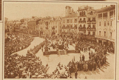
Erteilung des bischöflichen Segens auf der Piazza Grande in Locarno

Der bekannte Wallfahrtsort «Madonna del Sasso» feierte letzte Woche mit großen religiösen Festlichkeiten das Jubiläum seines 450jährigen Bestehens.