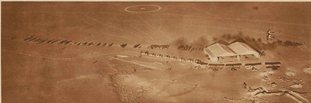
Fliegeraufnahme der Etappenstation Colomb-Béchar am Rande der Sahara. Links neben den Flugzeughallen sieht man eine Autokolonne, die die letzten Vorbereitungen für eine Durchquerung der Wüste trifft