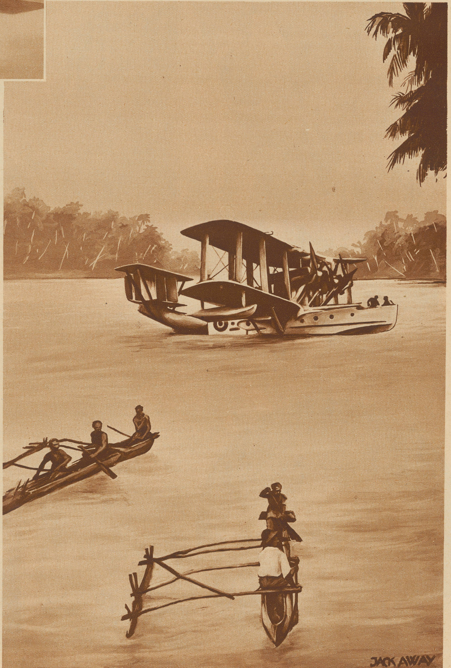
Wo Flüsse und Seen es ermöglichen, verwenden die Gesellschaften Wasserflugzeuge. Das Bild zeigt einen solchen Apparat einer englischen Linie

Es ist natürlich, daß gute Verkehrsverbindungen gleichzeitig einen wirtschaftlichen Aufschwung nach sich ziehen. Wirtschaftlicher Aufschwung wiederum zieht neue Menschen an. Neue Menschenmassen aber verlangen mehr Verkehrsmöglichkeiten. Das ist der ewige Kreislauf, der sich auch in den nächsten Jahrzehnten in Afrika bemerkbar machen wird.