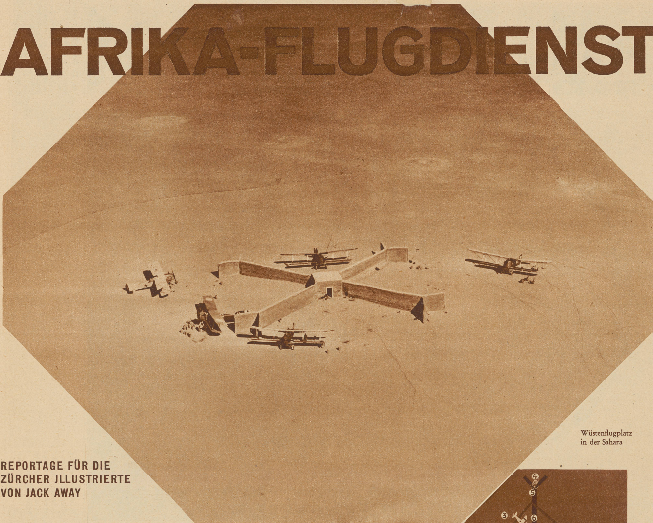
Wüstenflugplatz in der Sahara

REPORTAGE FÜR DIE ZÜRCHER ILLUSTRIERTE VON JACK AWAY