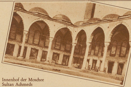
Innenhof der Moschee Sultan Achmeds

Im Schatten der Moscheekuppeln lacht ein Bettler.