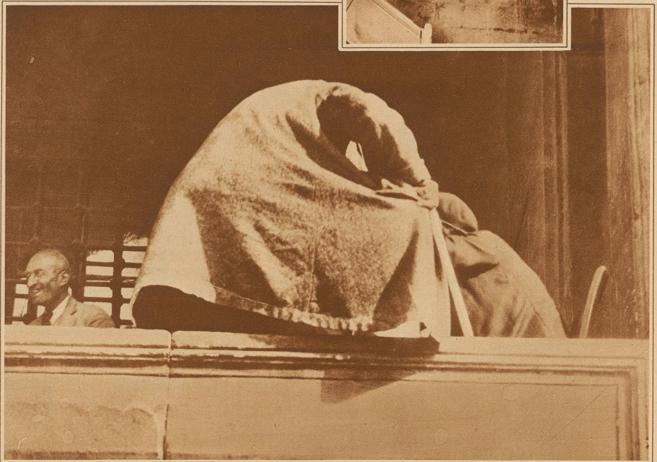
Es gelingt dem Liebesbrief-Schriftsteller sein Geschäft vor dem Photographiertwerden zu schützen