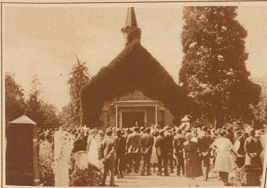
In Horn am Bodensee wurde am Sonntag zum Andenken an die verschollenen Ozeanflieger Käser und Lüscher eine schlichte Gedenktafel eingeweiht

Rascher als man dachte, ist der Dauerflugrekord der Gebrüder Hunter gebrochen worden. Die beiden Piloten Jackson und O'Brien blieben mit ihrem Apparat «Greater St. Louis» nicht weniger als 26 Tage und 23 Stdn. ununterbrochen in der Luft und überboten damit den früheren Rekord um 96 Stunden