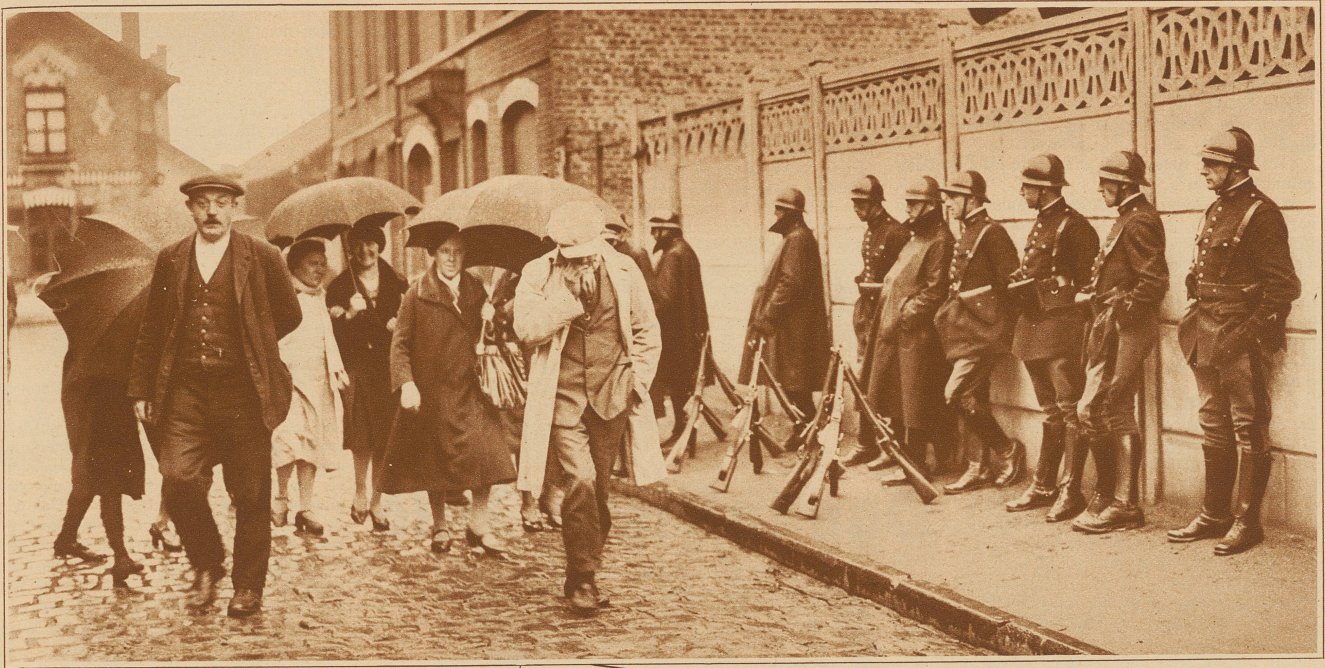
Im nordfranzösischen Industriegebiet streiken gegen 100 000 Arbeiter wegen der Einführung der Sozialversicherung. Um Ausschreitungen zu verhindern, wurden die Städte mit Militär belegt. Straßensbild aus Halluin