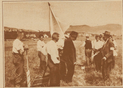
Der Kampfritze «Obmann» rechts, von einer weißen Fahne begleitet, von Rot zu Rot, um eventuell ererbende Mitglieder zu schützen. Hier hat eine Abseerpartei reklamiert, weil ein Graben quer durchs Rot geht, der das Spiel behindert; die Partei bekommt ein anderes Rot zugewiesen