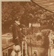
Mit dem Kapitän sind sie alle zufrieden, da sie kein Zweifel, sie vertrauen sich ihm gerne an