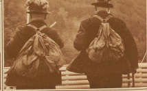
Aus U.S.A. Aus England? Aus Berlin? Mit den Blumen zum Hut? Nein! Die sind Mitglieder vom Schweizer Fußballklub oder von der Schweizerischen Handballgesellschaft. Edgenossen auf alle Fälle!