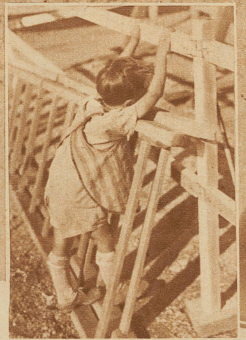
Ein kleiner Träumer

Hier ist's Pflicht der Eltern, einen gesunden Aegerer zu empfinden oder einen kräftigen Protest loszulassen — aber, wenn möglich, nicht ohne dabei an die eigene Lausbubenzeit zurückzudenken