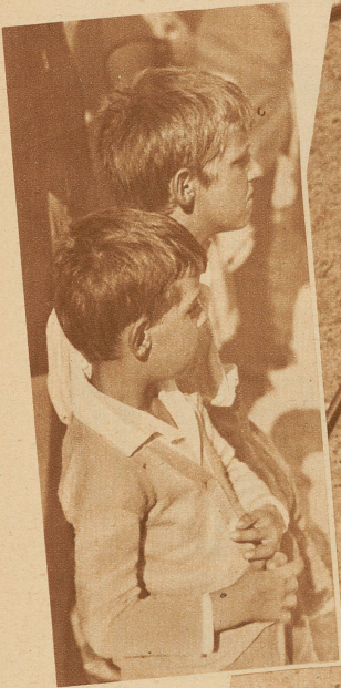
Zwei verschiedene Typen