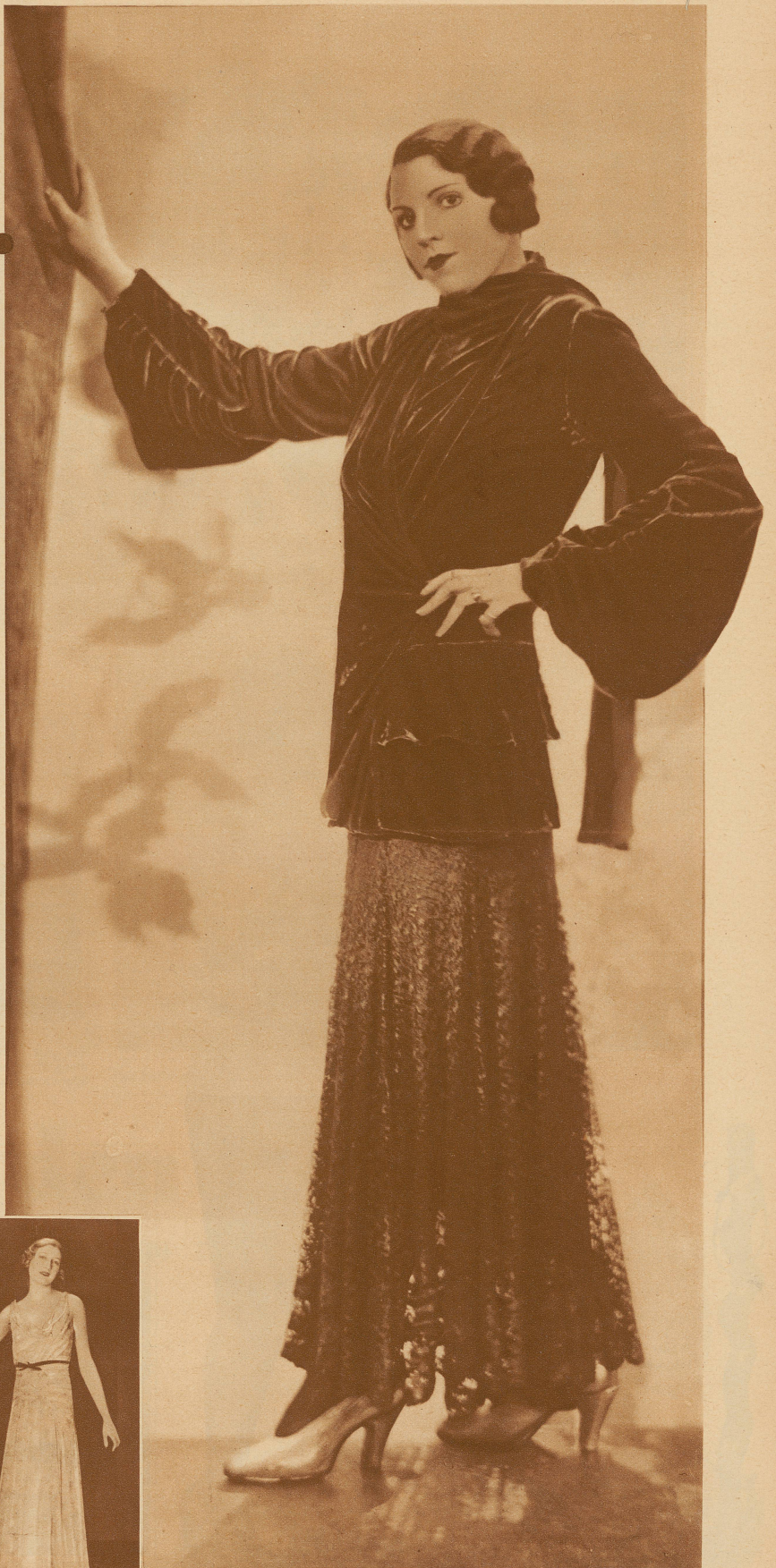
Zum Abendkleid das elegante Samtjäckchen