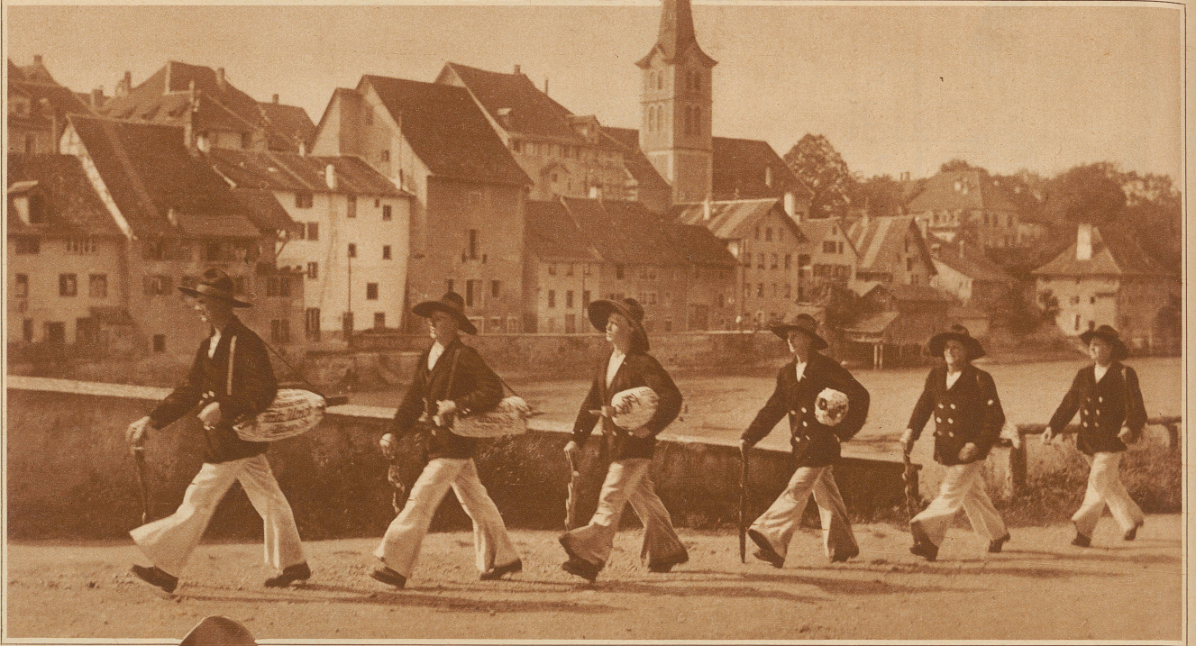
Zugvögel, die im Herbst nicht nach dem Süden, sondern nordwärts zieh'n: Hamburger Zimmerleute verlassen das Städtchen Dießenhofen