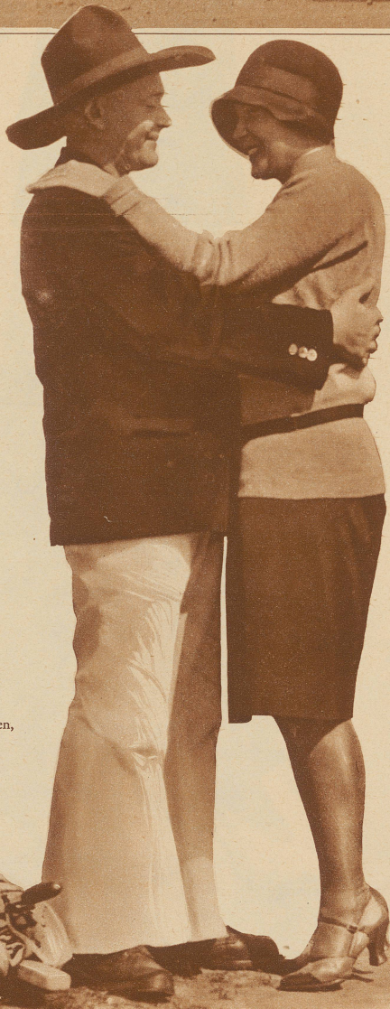
Allerlei Versprechungen, die hoffentlich den Winter überdauern