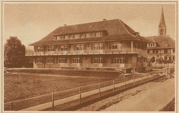
Das neue thurgauische Kinderheim in Romanshorn, das letzte Woche seiner Bestimmung übergeben werden konnte. Dem schönen Werk steht die Sektion Thurgau des Schweizerischen Verbandes Frauenhilfe zur Seite