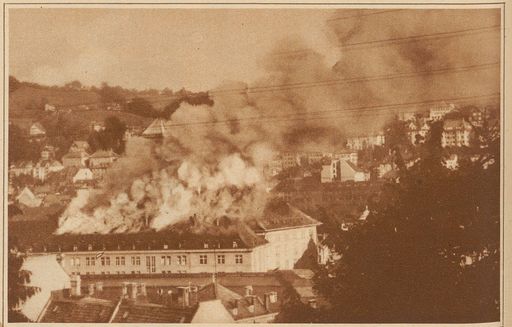
Brand des St. Galler Hauptbahnhofes. Im Mittelbau des im Jahre 1914 vollendeten Bahnhofes St. Gallen brach letzte Woche Großfeuer aus. Der Dachstock ist vollständig ausgebrannt; der Schaden beträgt etwa 70 000 Franken. Als Brandursache wird ein Kaminbrand vermutet