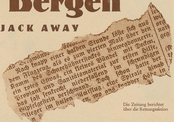
Die Zeitung berichtet über die Rettungsaktion

Die Rettung von Vermissten und Verunglückten zählt zu den vornehmsten Aufgaben des Schweizer Alpen-Clubs. Um sie erfüllen zu können, hat er eine weitverzweigte Organisation geschaffen, deren Glieder bis weit hinauf in die entlegensten Bergtäler reichen und seit vielen Jahren vorzügliche Dienste leisten. Die zur Verfügung stehenden Hilfsmittel haben in letzter Zeit eine wertvolle Bereicherung erfahren: Das Flugzeug. Seine große Schnelligkeit und sein weites Gesichtsfeld auszunützen, um dadurch in einem Bruchteil der früher benötigten Zeit Hilfe bringen zu können, war