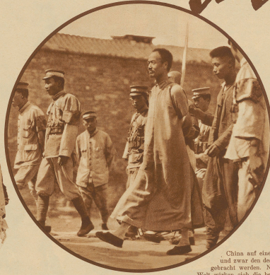
Ein politischer Verbrecher wird zum Exil verurteilt. Die Tüfel auf seinen Rücken enthält das Todesurteil. Fremden der Mann weiß, daß er nur noch wenige Minuten zu leben hat, schreit er auf und weint.

China auf einen Generalherrscher und zwar den des sozialen Elends gebracht werden. Nirgendwo in der Welt wirken sich die beiden Gegensätze, Bitterkeit und Sozialismus, konservative Weltanschauung und moderner Einfluß, so gewaltig und folgenschwer aus, wie in China. China erwacht, bekennt sich auf sich selbst, beginnt die müßigen und faulen Winkel auszuräumen, und der gewaltige Riesenleib zuckt unter der Einwirkung westlicher Zivilisation wie ein Organismus, dem man zu viel belebendes Element injiziert hat. — Kein Wunder, daß auf diesem Boden sich der Kommunismus als neue Staatsidee leicht ausbreiten kann und sich in gut organisierten Zustand den Weg zu bahnen vermag. Das Vorbild Europas, das lange Jahre der farbigen Rasse gegeben wurde, war in vieler Hinsicht kein gutes. Daß christliche Nationen sich vier lange Jahre in einem der blutigsten Kriege verflochten, mußte auf fernstehende farbige Völker, denen man das Christentum als eine friedvolle, versöhnliche Religion hinstellte, keinen guten Eindruck machen. Noch mehr hat es den Prestige der weißen Rasse geschadet, die während des Krieges viele Hunderttausende farbige, Schwarze und Gelbe, an den Fronten beschäftigte und sie gegen Weiße führte.