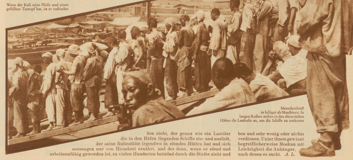
Menschen sind billiger als Maschinen in hegen Fabriken stehen in den chinesischen Häfen die Lasten zu, um die Schiffe zu entladen.

schließlich in diesem oder jenem Winkel wie ein Hund stirbt, ist mit das gefährlichste gährende Element, das sich in China zu diesen wohlorganisierten Banden unter dem Befehl irgendeines mächtigsten Generals zusammenruft, plündert, Städte in Brand steckt, Europäer verschleppt und sie nur gegen heftiges Lösegeld freigibt. Kuli ist im eigentlichen Sinne des Wortes der chinesische Tagelöhner, der Bettler, der Arbeitslose, der Gelegenheitsarbeiter, die ohne Ausnahme alle ganz kleine Bedürfnisse