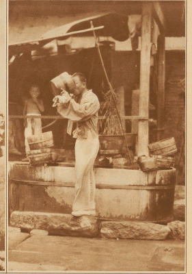
Trunkschiff für Räuberkäuf in den Straßen Pekings

Rußland, das infolge seines schnell wachsenden Industrieertrags mit allen möglichen Mitteln versucht, sich gesinnungstreue Bindesgenossen zu verschaffen, sucht sie mit seiner kommunistischen Idee, analog den hyperinflatorischen Bestrebungen der früheren Garowregierungen, in den unterdrückten breiten Massen Indiens und Japans. — Dort, wo der Arbeiter kaum 50 Rappen im Tag verdient und die Armut, das Elend und der Hunger unter vielen Millionen Menschen sich breit macht, kann es auch nicht ausbleiben, daß sich solche Zustände bilden wie in China. Der Kuli, der mühsam von frühen Morgen bis in die Nacht hinein bei gütlichen Sonnenstrahl seine Räschka durch die staubigen Straßen