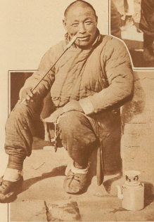
Wenn der Kuli seine Pfife und einen gefüllten 'tsoow' hat, ist er zufrieden.

Könnte es da ausbleiben, daß sich der Chinese sagt, ja, er weilt Mann, der uns betrübt, unser Gold, Silber, Kohle und andere wertvollen Dinge im Lande castlellt, der uns eine bessere Religion künden will, sieht ja ganz anders aus, viel schlimmer, wie wir ihn uns vorgestellt haben. Er brachte uns Opium, um uns schwach zu halten, er machte uns arm, nur damit wir seine Sklaven würden. So sprach der Chinese und so wachte der Fremdenhaß und mit ihm auch in der breiten Masse der Haß gegen alles Bürgerliche.