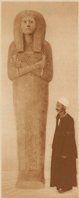
Der äußere Sarg mißt über 3 m