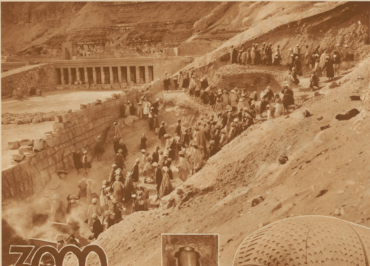
Der Wall des Tempels der Hatschepsut (Theben) wird auf der Außenseite freigelegt. Hier fand die Expedition ein großes Grabgewölbe mit dem Sarg der Königin Meryet-Amün