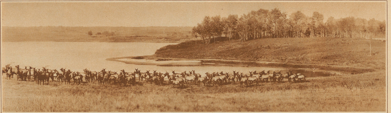
RENNTIERHERDE IM WAINWRIGHT NATIONALPARK, KANADA