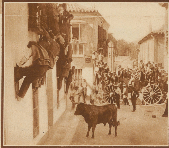
Die Stiere jagen in die Arena

Im spanischen Städtchen Pamplona herrscht eine eigentümliche Sitte. Jährlich einmal, zu Beginn der großen Stierkämpfe, werden die Tiere in wilder Jagd durch die Straßen der Stadt getrieben. Die Gassen sind mit Brettern abgeriegelt, auf den Balkonen der Häuser sammelt sich die ganze Bevölkerung. Die jungen Toreros und ihre jugendlichen Freunde laufen vor den gehetzten Stieren her. Der ganze übrige Verkehr der Stadt muß ruhen und die Bevölkerung ist stundenlang auf den Beinen, um das eigenartige Schauspiel mitanzusehen. Schließlich werden die Tiere am Schlusse der aufregenden Jagd in die große Arena getrieben und die eigentlichen Stierkämpfe beginnen.