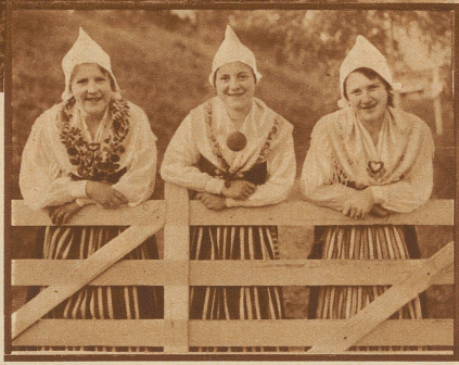
Junge Schwedinnen im Sonntagsstaat

«Stockholmsutställningen 1930» ist das skandinavische Schlagwort dieses Jahres. An einer der bis mitten in die Stadt Stockholm reichenden Ostsee-