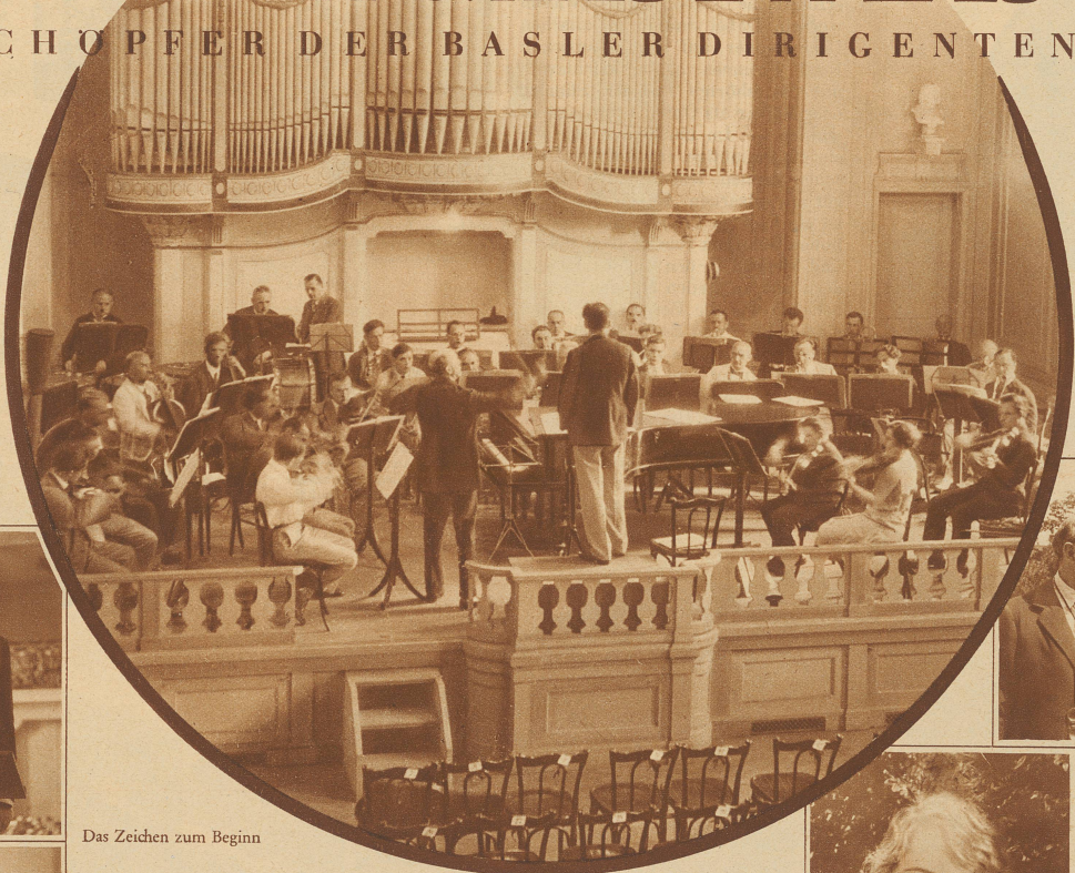
Weingartner korrigiert einen Dirigentschüler. Den Schülern steht in fast voller Besetzung das vorzügliche Orchester der Basler Orchestergesellschaft zur Verfügung