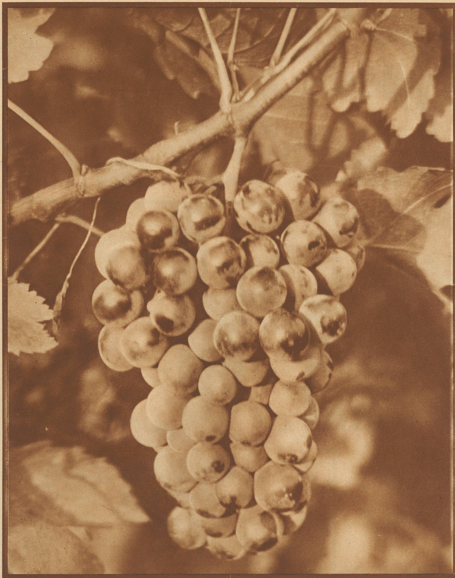
IM DUNKEL DES REBLAUBS Phoc. Trieb