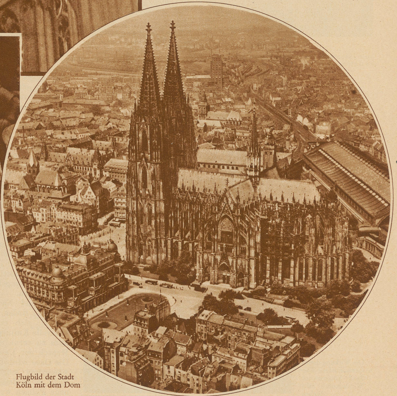
Flugbild der Stadt Köln mit dem Dom