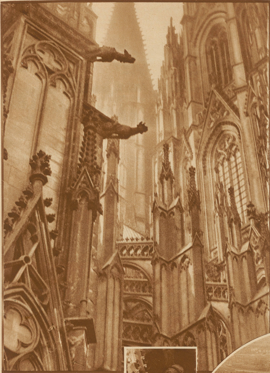
Die Türme des Kölner Domes in der Morgensonne