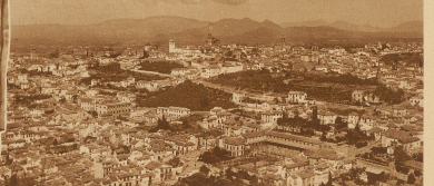
Zigarennensüßigkeiten. Zerfallene Besenwohnungen der Salzenkochen diesen: heute noch als Schlupfwinkel für Bettler und Zigeuner.

Die Alhambra, die auf einem imposanten Hügel der Stadt Granada erbaut wurde, ist da herabberende Klimate, die Spanien seinen Besuchern zeigen kann. Wer dieses Kulturdenkmal sehen durfte, hat Unvergessliches erlebt und träumt immer wieder von Rückkehr. Sein bedeutendster Schöpfer und Baumeister, Mohammed V. war nicht bewußt, ein Kulturwerk geschaffen zu haben, das schmerzlich noch überleben werden kann. Kaiser Karl V., der einen noch imposanteren Palast neben die Alhambra bauen wollte, erlitt bei seinem Verzuge vollständige Schiffbruch. — Obige Bild zeigt den kriegsgeschicklichen Janissar, in dem 1492, während der Eroberung der Alhambra durch Ferdinand und Isabella der erste Dankgedächtnis abgehalten wurde.