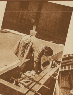
Die Arbeit am laufenden Brunnen im Hof soll viel gesünder sein als in der modernen Waschlische.