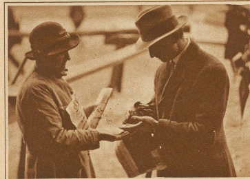
Er kauft — — — die «Zürcher Illustrierte»