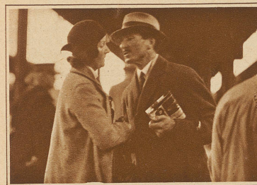
— — nimmt Abschied von seiner Frau, begibt sich in den Wagen