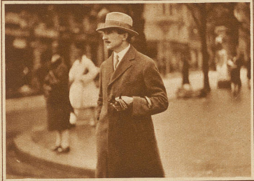
Der Dichter hat das Hotel «St. Gotthard» verlassen und begibt sich zum Bahnhof

In diesen Tagen hat die schweizerische Schillerstiftung dem Schriftsteller Jakob Schaffner ihren «Großen Preis», die höchste ihr zur Verfügung stehende Auszeichnung verliehen. Die Ehrung fand in Basel statt im Münstersaal des Bischofshofes. Jakob Schaffner sprach dort in einer Rede vom Urcharakter der Basler und von seiner eigenen flackernden, schweifenden Fernsicht. So ist es nur im Stile Schaffners, wenn unser Photograph ihn nun nicht beim Stillsitzen, sondern in der Unruhe seiner Abreise von Zürich nach Deutschland zurück aufgenommen hat