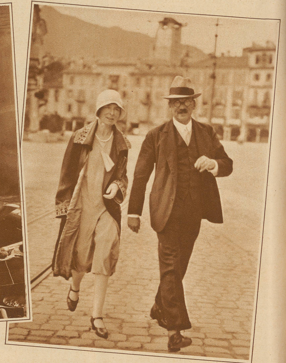
Prof. Sauerbruch Der bekannte Chirurg und frühere Professor an der Universität Zürich befindet sich zur Zeit in Locarno