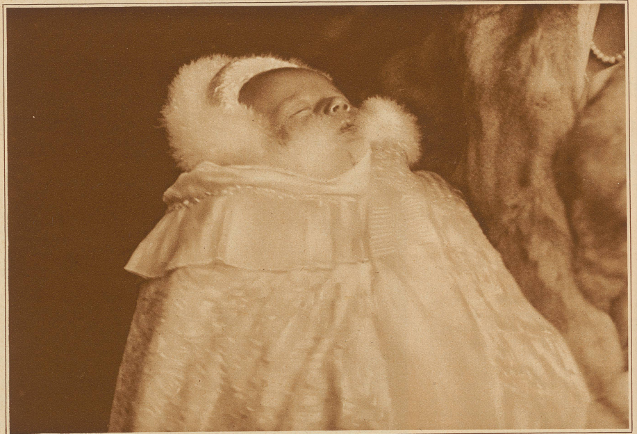
Ist's ihm anzusehen? Dies ist nämlich kein alltägliches Kleines, so wie sie jederzeit geboren werden, dies ist vielmehr der kleine Prinz Baudoin, Sohn des Herzogs von Brabant und der Prinzessin Astrid von Belgien. Sein Großvater ist der König von Belgien und der Kleine soll einmal den belgischen Thron erben