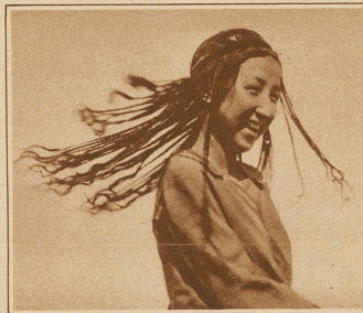
Usbekische Studentin bei einem Nationaltanz. Nach der Landessitte ist ihr das Haar in über 50 Zöpfe geflochten