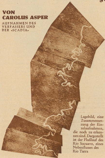
Lagebild, eine Zusammensetzung der Einzelaufnahmen, die noch zu erkennen sind. Dargestellt ist der Flußlauf des Rio Socuavo, eines Nebenflusses des Rio Tarra

VON CAROLUS ASPER