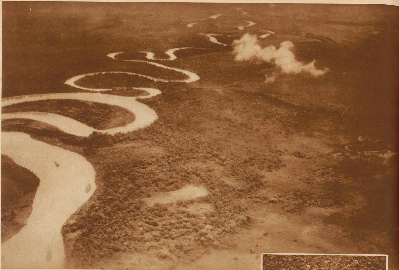
Eine der 2000 Flugaufnahmen, die auf Veranlassung der mit der Schlichtung des Grenzstreites zwischen Kolumbien und Venezuela betrauten schweizerischen Schiedsrichter gemacht wurden. Das Bild zeigt den Zusammenfluß des Rio II mit dem Rio Tarra, eines Nebenflusses des Rio Catatumbo. So weit das Auge reicht ist alles Sumpf- und Urwaldgebiet