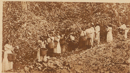
Der wichtigste Ausfuhrartikel Kolumbiens ist immer noch der Kaffee, der in unzähligen Hacienden im ganzen Lande geerntet wird