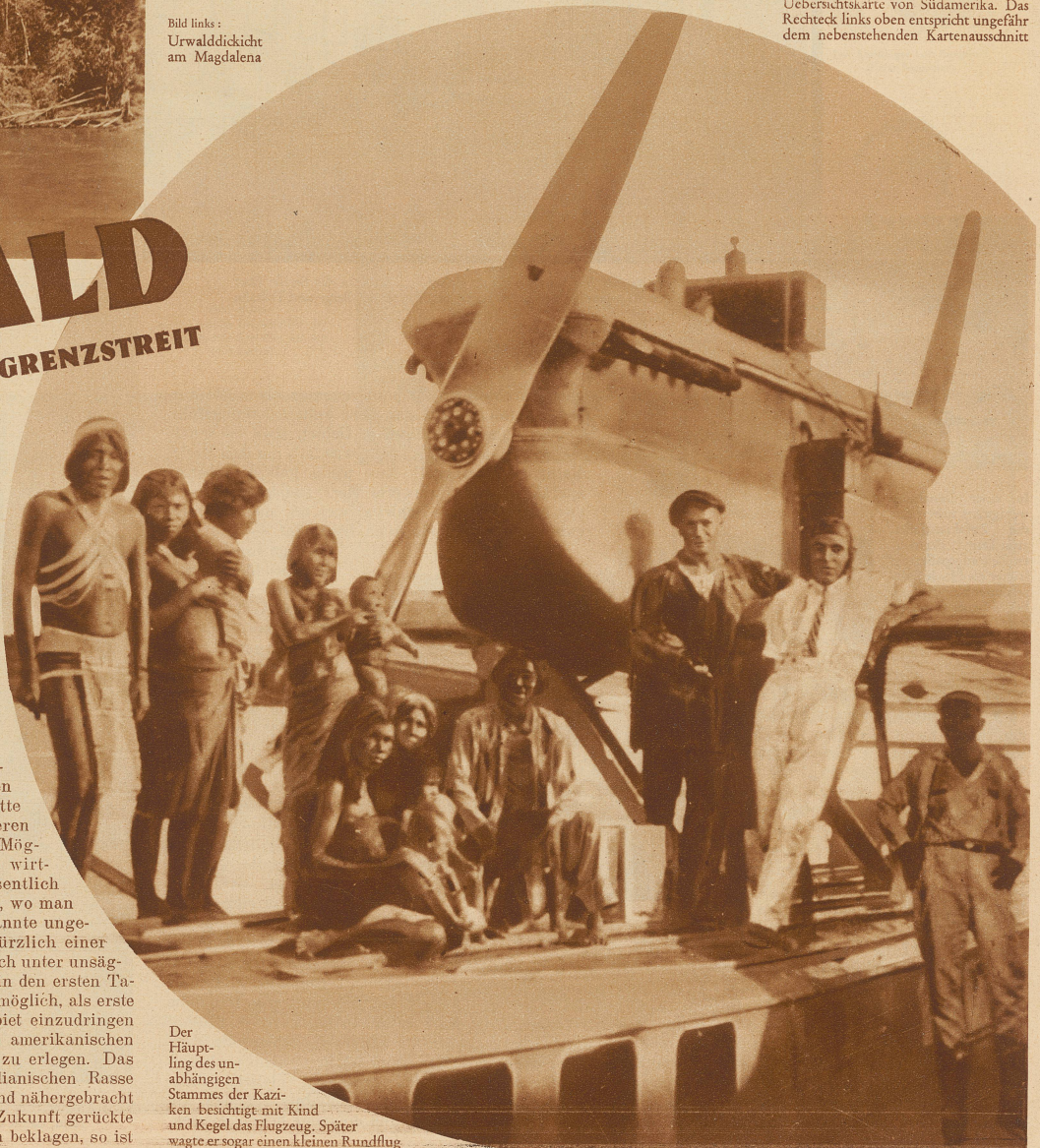
Der Häuptling des unabhängigen Stammes der Kaziken besichtigt mit Kind und Kegel das Flugzeug. Später wagte er sogar einen kleinen Rundflug

treffenden Gebietes eines Flugzeuges der Deutsch-Kolumbianischen Luftverkehrsgesellschaft «Scadta» bedienten, das rund 2000 Einzelaufnahmen machte, die dann zuerst zu Lagebildern und endlich zu einer Gesamtkarte zusammengestellt wurden, auf welcher der genaue Verlauf der Grenze festgelegt werden konnte. — Doch diese luftphotographische Vermessung hatte noch einen wichtigen Nebenerfolg: es war gelungen, mehrere der Rundsiedlungen der wilden Motilonen auf die Platte zu bannen und so zum erstenmal deren Lage festzustellen, wodurch die Möglichkeit der Erschließung dieses wirtschaftlich wichtigen Gebietes wesentlich erleichtert wurde. Man wußte nun, wo man den Feind zu suchen hatte und kannte ungefähr Weg und Steg. So war es kürzlich einer Expedition — wenn auch immer noch unter unsäglichen Schwierigkeiten und gleich in den ersten Tagen unter Verlust von 17 Mann — möglich, als erste ein kleines Stück weit in das Gebiet einzudringen und dabei zufällig auf den ersten amerikanischen Menschenaffen zu stoßen und ihn zu erlegen. Das alte Rätsel der Herkunft der indianischen Rasse dürfte damit seiner Lösung bedeutend nähergebracht sein. — Mag man die nun in nahe Zukunft gerückte Unterwerfung dieses Stammes auch beklagen, so ist