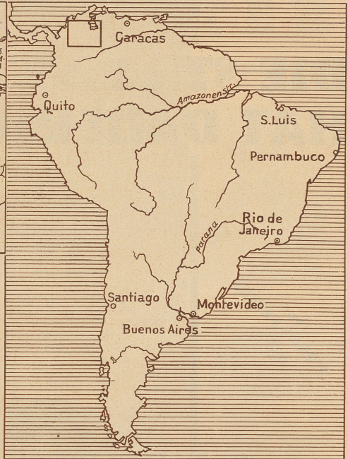
Übersichtskarte von Südamerika. Das Rechteck links oben entspricht ungefähr dem nebenstehenden Kartenausschnitt