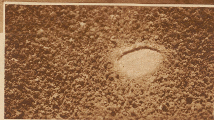
Runde Motilonensiedlung inmitten des Urwaldes. Bis zu diesen Aufnahmen wußte man nicht, ob die überaus kriegerischen Motilonen in geschlossenen Ortschaften oder nur in Einzelgehöften leben

Fast seit den ersten Tagen der Entdeckung bis in unsere Zeiten war der Verlauf der Grenze zwischen den früheren Generalkapitanaten Santa Fe und Caracas, den heutigen Republiken Kolumbien und Venezuela, der Gegenstand fortwährenden Streites, weil ihr Verlauf infolge der Unzulänglichkeit des Terrains nicht genau festgelegt werden konnte. Nicht allein die allgemeinen Hindernisse des tropischen Waldes: Sumpf um hochragende oder von Alter und Sturm niedergelegte Baumriesen in unentwirrbarem Geflecht verschlungene dornige Schlingpflanzen, die üppige Vegetation, Moskitos, Giftschlangen, Tausendfüßer, Skorpione und Fieber stellten sich jedem Vordringen in den Weg, sondern daneben noch ein zwar kaum 6000 Köpfe starker, aber ungemain kriegerischer und durchaus kulturfeindlicher Indianerstamm, die Motilonen, der die natürliche Festung seiner Heimat mit vergifteten Pfeilen und Blasrohrgeschossen gegen jede fremde Invasion erfolgreich verteidigte, zugleich aber durch blitzschnelle Raubüberfälle ständige Beunruhigung in die kultivierten Grenzbezirke trug und manche davon einfach unbewohnbar machte. — An diesen Schwierigkeiten waren nicht nur alle wissenschaftlichen, wirtschaftlichen und Strafexpeditionen gescheitert, sondern auch alle Grenzkommissionen, die im Lauf der letzten Jahrzehnte wiederholt das Land vermessen sollten, bis die von den beiden beteiligten Regierungen ernannten schweizerischen Schiedsrichter sich zur kartographischen Aufnahme des be-