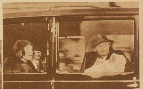
Wie eine Prinzessin getauft wird. In der Kapelle des Buckingham Palastes in London fand die Taufe der kleinen Prinzessin Margaret, der Tochter des Herzogs und der Herogin von York statt. Die ganze königliche Familie war anwesend. Der Erzbischof von Canterbury taufte die kleine Prinzessin, die mit dem kostbaren Taufkleid der früheren Königin Viktoria angetan war, mit Wasser aus dem Jordan. Das Bild zeigt die Fahrt zur Taufe. Die kleine Prinzessin im Arm der Amme, links die Eltern