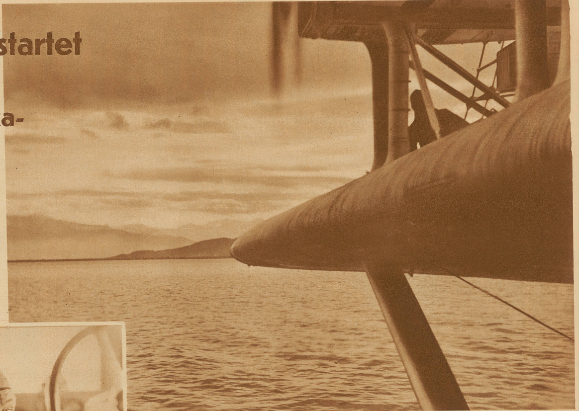
Ueber dem Bodensee. Blick von der Führerkabine auf Tragfläche und Motortürme. Die Mechaniker können auch während des Fluges zu den Motoren gelangen und eventuelle Störungen beheben