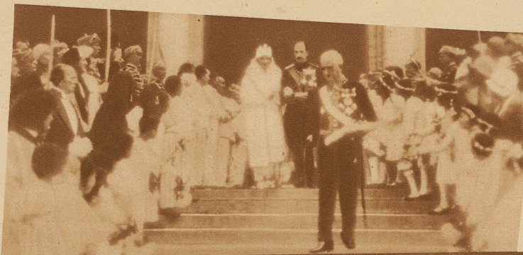
Bild rechts: Radiotelegraphisch übertragenes Bild von der Trauung des Bulgarenkönigs Boris mit Prinzessin Giovanna in Sofia. Im Gegensatz zur ersten Feier in Assisi wurde die Trauung in Sofia nach griechisch-orthodoxem Ritus durchgeführt. Das Königspaar verläßt die Nevsky Kathedrale nach der Hochzeit, die mit der Krönung der Königin verbunden war