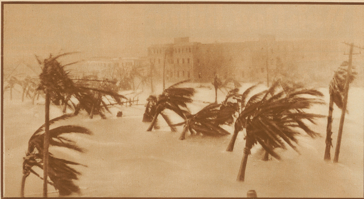
Palmen im Tropensturm. Um diese Jahreszeit wüten an der Ostküste Amerikas gewaltige Sturmwinde, die große Verwüstungen anrichten. So zeigt das Bild eine kleine Hafenstadt, deren Strandpromenade metertief unter Wasser gesetzt wurde