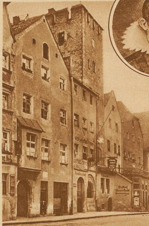
Keplers Wohn- und Sterbehaus in der heutigen Keplerstraße in Regensburg. Das Haus (mit dem Erker über dem Eingang) hat sich bis zum heutigen Tag unverändert erhalten

Diese fetten Titelzeilen waren nur Tirailleurs, Plänkler, die den großen Feldzug einleiteten, der um Al Riffles beginnen sollte. Trotz ihres glänzen-