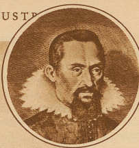
Zeitgenössisches Bild Johannes Keplers